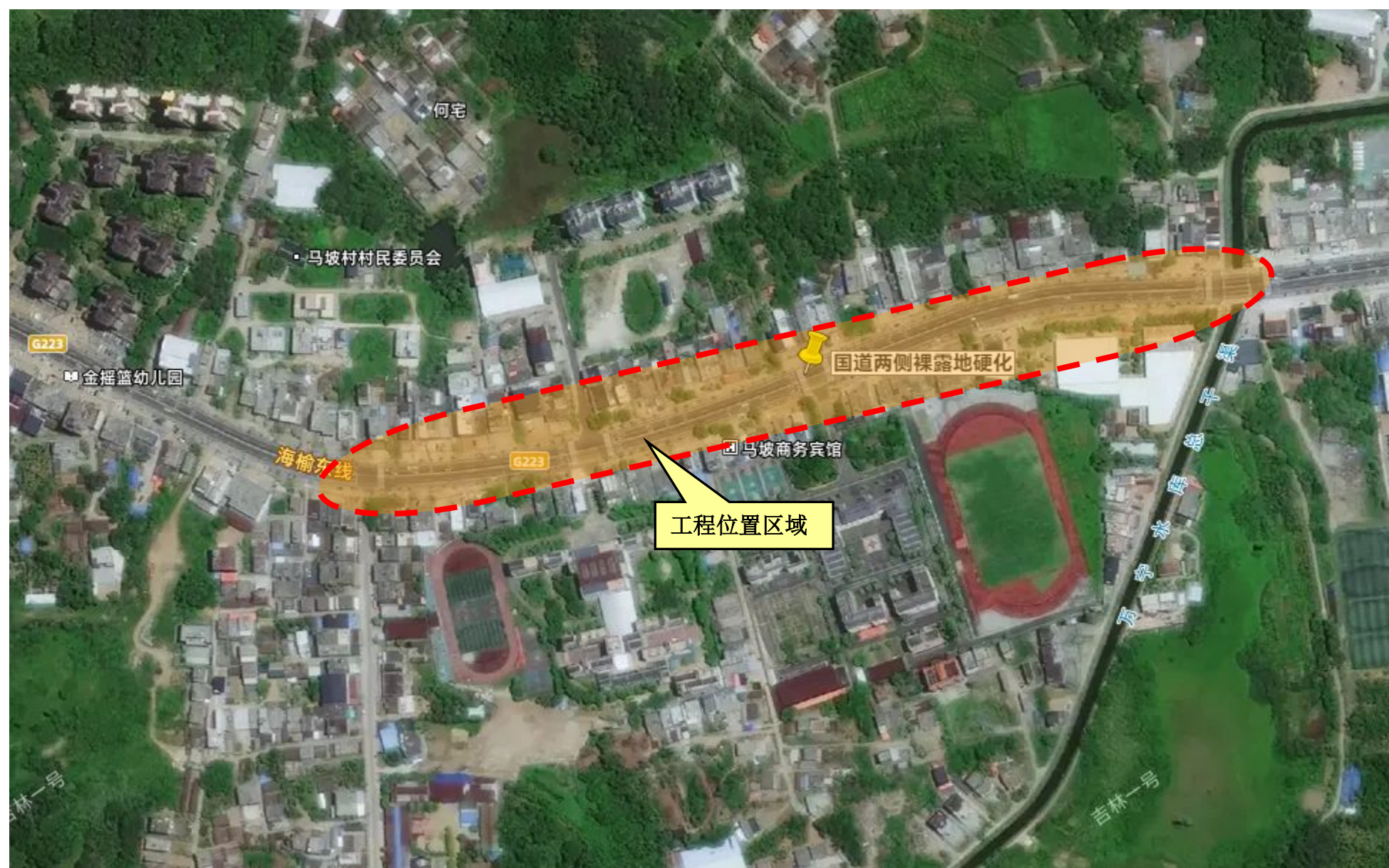
▲国道两侧裸露地硬化（马坡村）地理位置示意