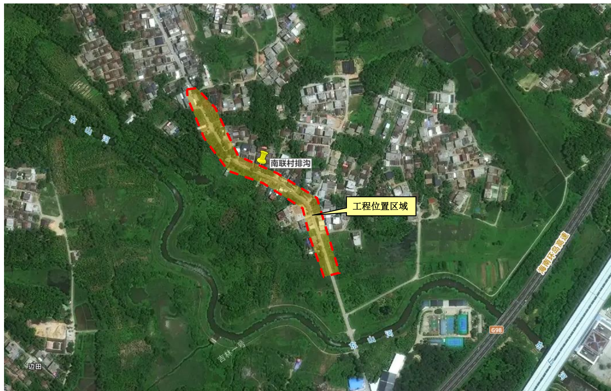
▲南联村排沟地理位置示意