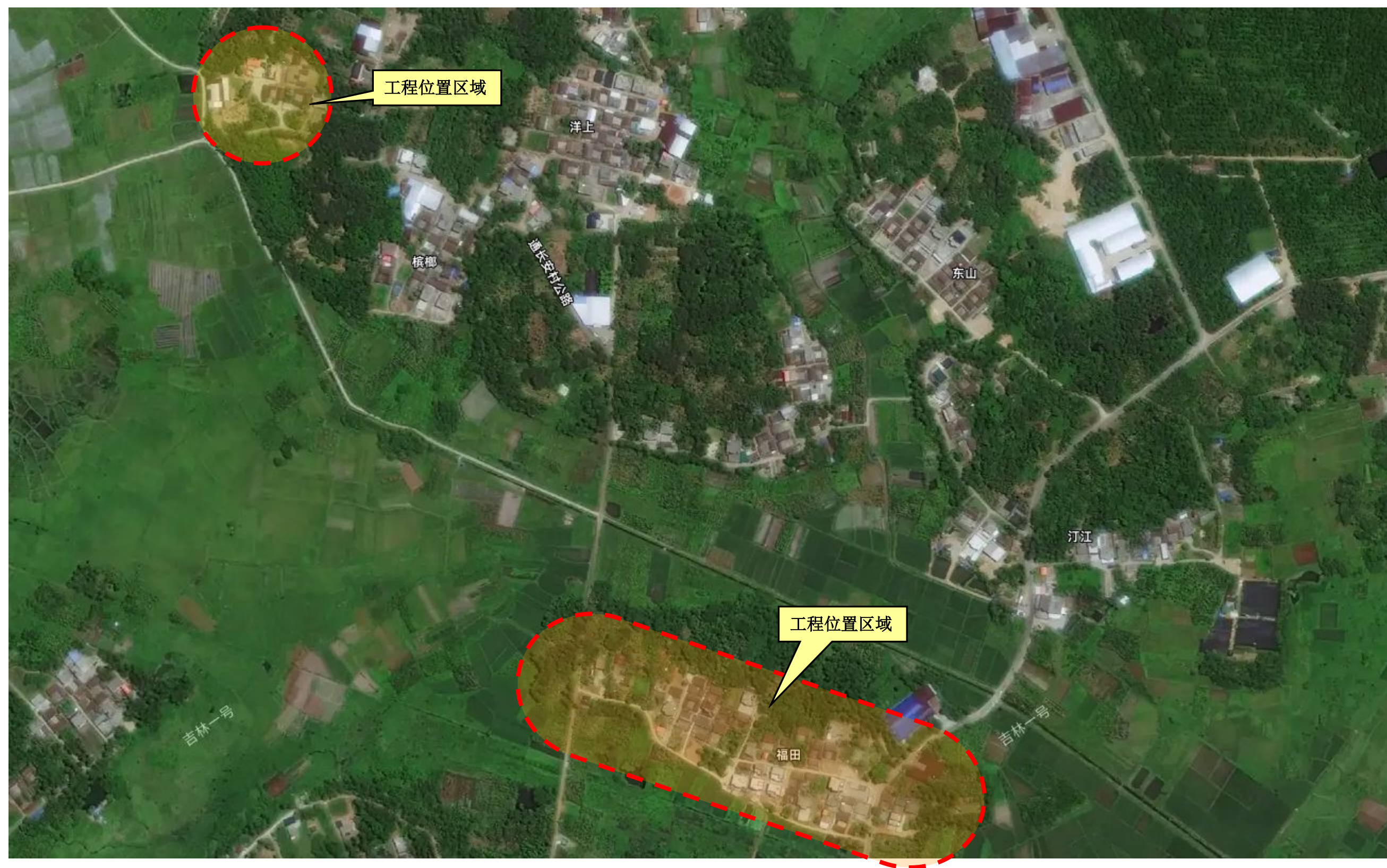
▲长安村硬化入户路地理位置示意