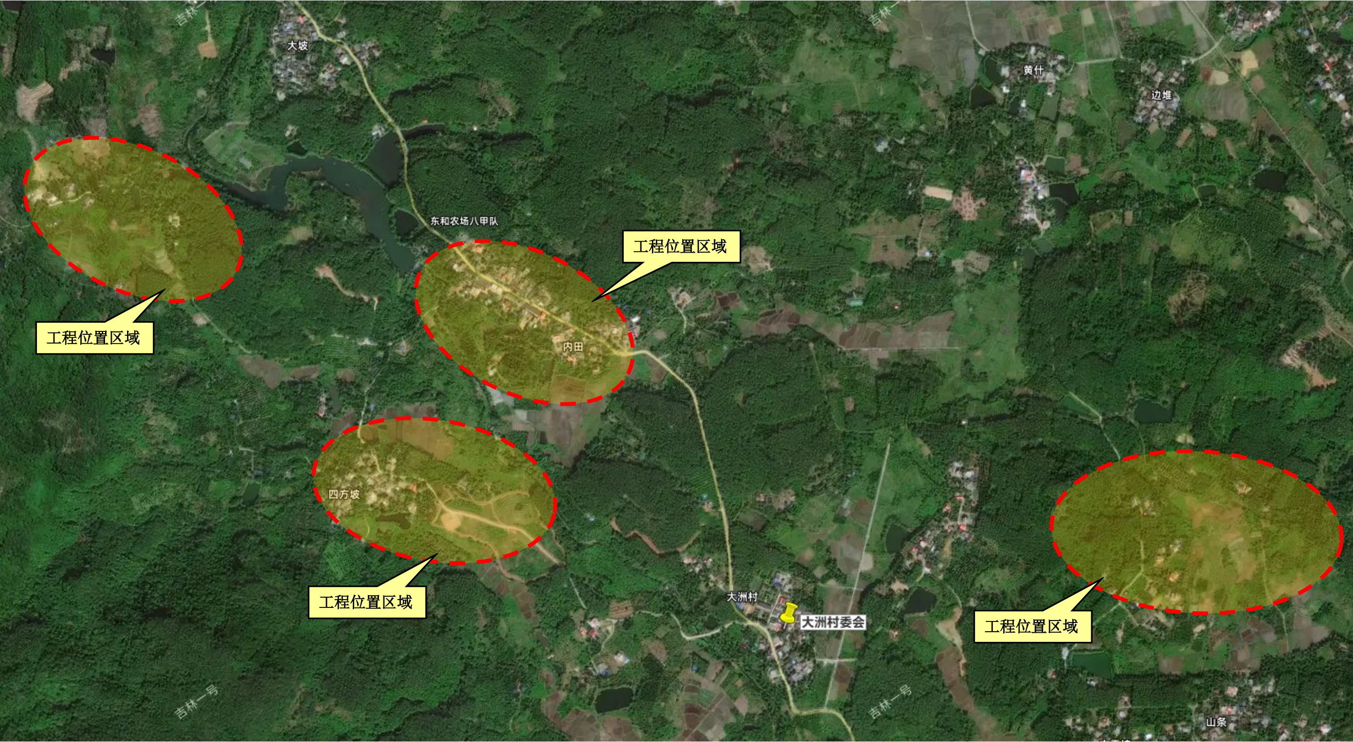
▲大洲村硬化入户路地理位置示意